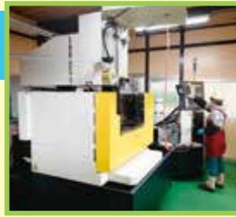
ワイヤカット放電加工機

住所 松江市美保関町森山650-1 TEL 0852-72-2008 FAX 0852-72-2010 http://www.matsuekoki.jp