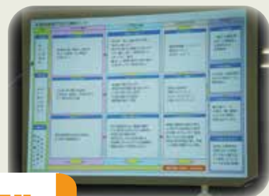
商品展開プロセス検討シート

商品開発と販路開拓の関係性、商品開発および販路開拓の留意点、商品展開プロセス検討シートおよびFCP展示商談会シートの留意点と作成方法 など