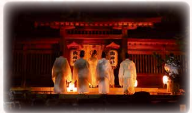
佐太神社 神在祭「神迎神事」